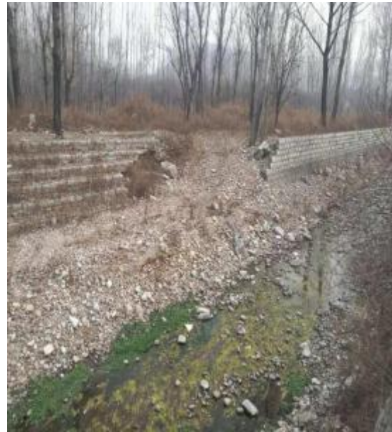
(3) 水毁破坏程度调查

沂城峪口河道右岸挡墙基础常年冲刷，导致基础掏空，整体墙身坍塌，坍塌的砌石被冲至河道内，阻碍河道行洪，且危险到其他挡墙安全。